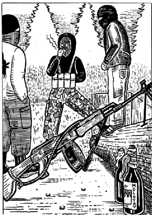
Des guerriers à Oka. Dessin publié dans Warrior, n°1, printemps/été 2006

La campagne généralisée de blocages, de sabotages et d'occupations a servi à rendre extrêmement coûteuses les tentatives d'expulsion des Mohawks de leur occupation et s'est avérée très efficace pour assurer leur victoire dans la protection de leurs lieux de sépulture et de leurs pins.